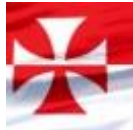
Znaki ogólne kawalerii hetmańskich/ husarii/