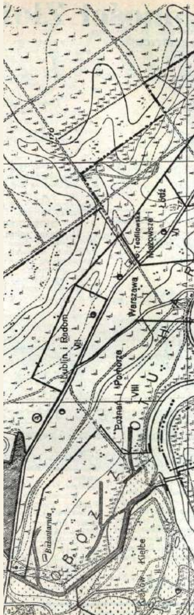
Teren Zlotu Harcerzy Skala 1 : 10.000.